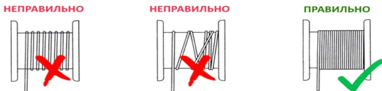
Рисунок 3. Намотка троса на катушку.

Лебедка модели FD оснащены храповым механизмом, препятствующим произвольному вращению барабана. При работе с лебедками категорически запрещается снимать фиксатор храповика.